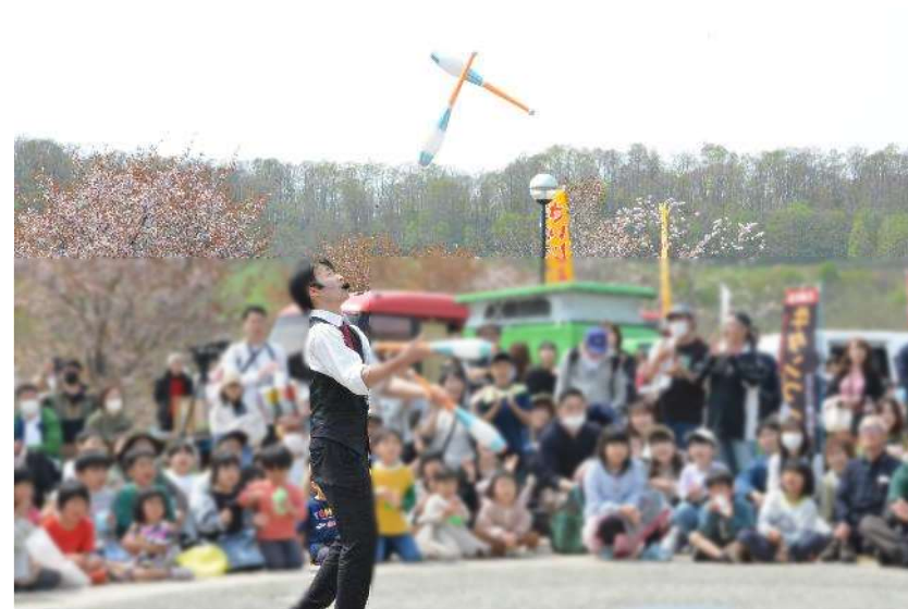
▲大道芸エクストリーム芹川