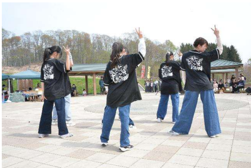
▲ストリートダンス X-Vi Crew×P★DASH KIDS