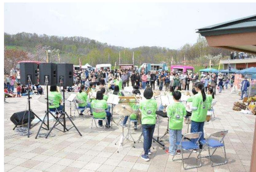
▲鷹栖中学校吹奏楽部ミニコンサート