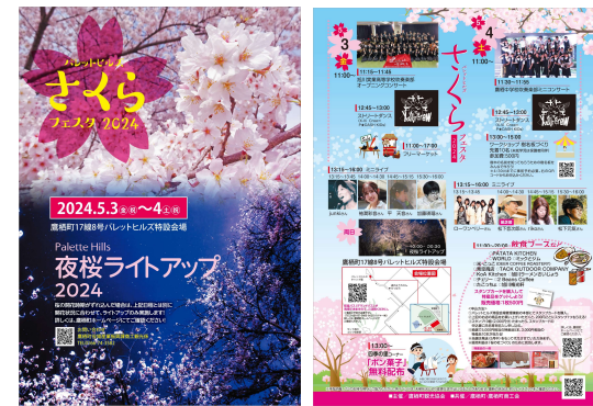
<さくらフェスタ・夜桜ライトアップ2024 チラシ>