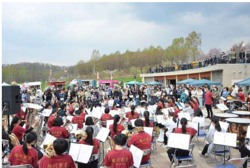
▲旭川実業高等学校吹奏楽部オープニングコンサート