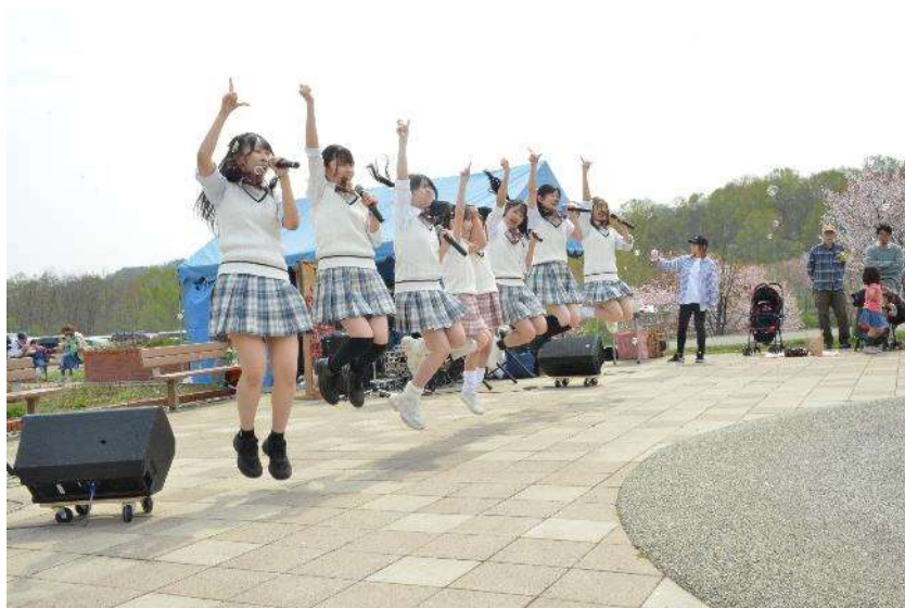
▲旭川ご当地アイドル ローワンベリー