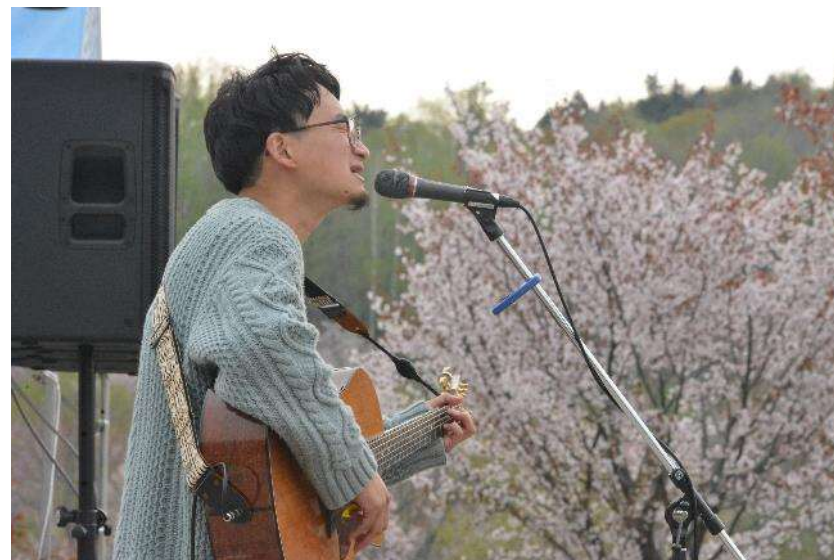
▲シンガーソングライター 松下 元気