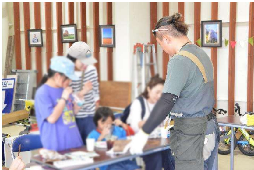
▲ワークショップ 樹名板づくり